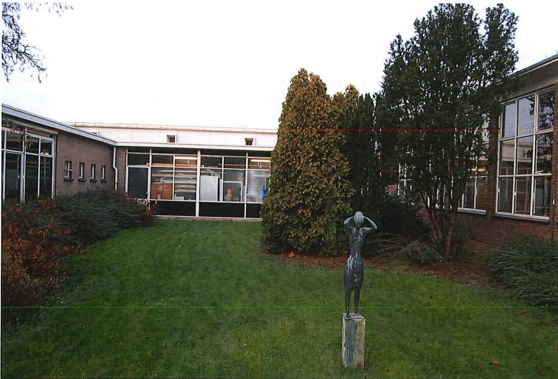
Overzicht van de binnenplaats.