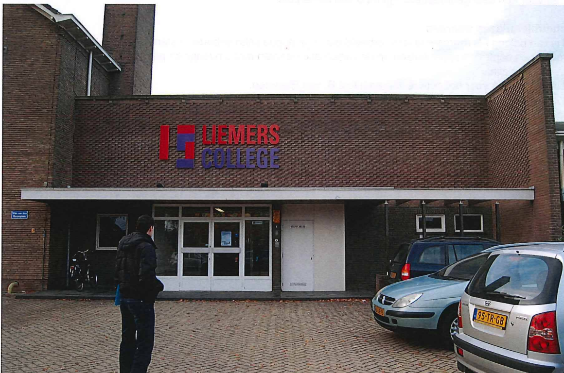
Hoofdentree in het tussenlid aan het Vestersbos.